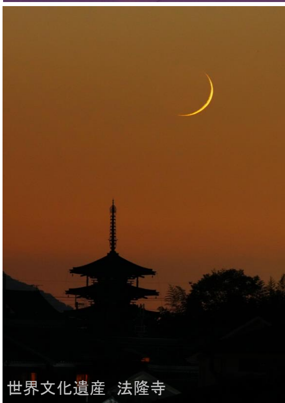
世界文化遺産 法隆寺