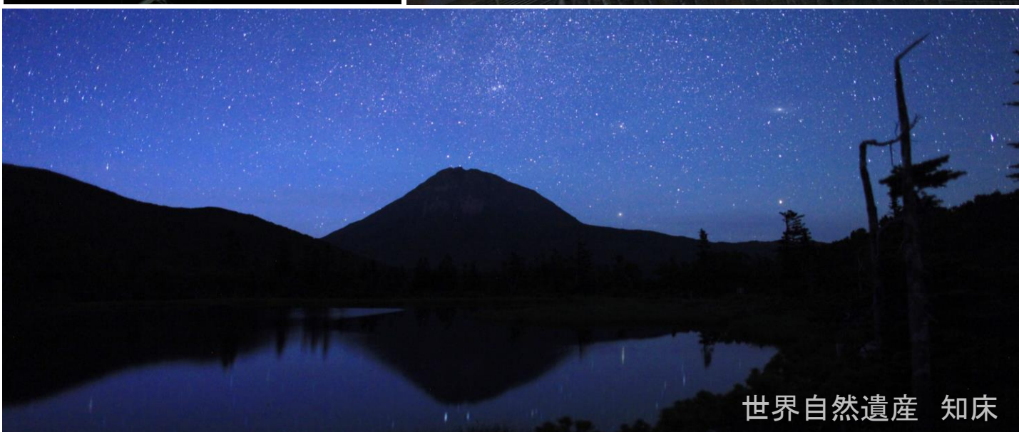
世界自然遺産 知床