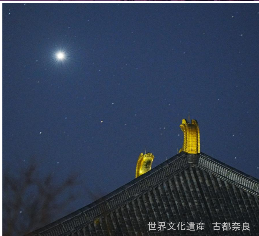
世界文化遺産 古都奈良